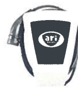
Wallbox inkl. Schnellade- funktion 720,00 €