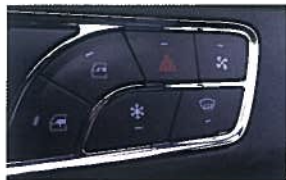
Klimaanlage 830,00 €