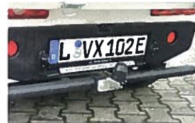
Rammschutz hinten mit Anhängerkupplung* 640,00 €