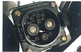
DC High Schnelladekabel 420,00 €