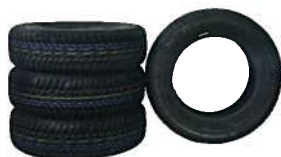
4x Winterreifen 410,00 €