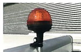
Orange Rundumleuchte inkl. DIN Beklebung 190,00 €