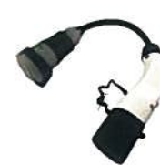
Typ 2 Adapter für Ladesä- ulen und -Wallboxen 249,00 €