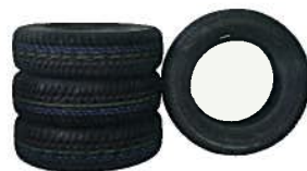
4x Ganzjahresreifen 480,00 €