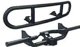
Rammschutz vorne & hinten 890,00 €