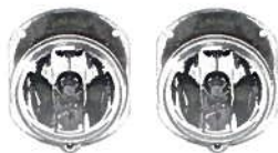
2x Nebelscheinwerfer 249,00 €