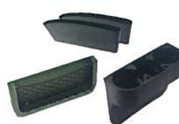
Innenraum Ablagepaket 190,00 €