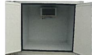
12V Kühlanlage für Kühlung im Stand und während der Fahrt 4.200,00 €