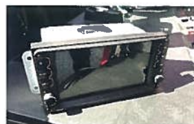
Touchscreen Radio mit Freisprecheinrichtung und Rückfahrkamera 520,00 €