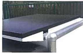
Solaranlage für 90 km mehr Reichweite 3.950,00 €