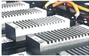
Lithium Ionen Akku für 150 km Reichweite (im Preis enthalten) 0,00 €