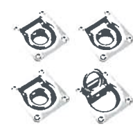
Verzurrösen im Laderaum 120,00 €