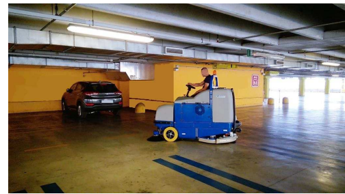
Industrieller Einsatzbereich, Logistik, Parkhaus etc.