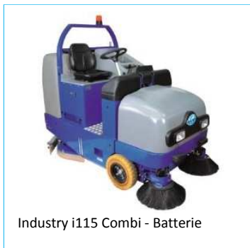
Industry i115 Combi - Batterie