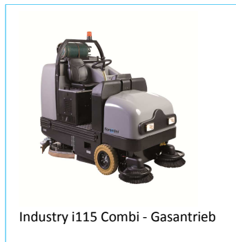
Industry i115 Combi - Gasantrieb