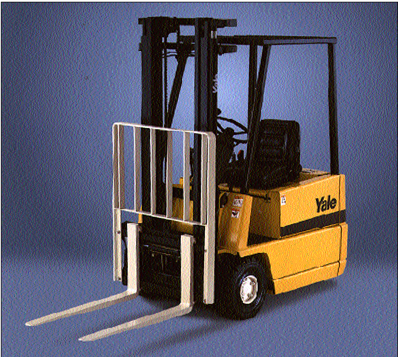
Der dargestellte Stapler enthält Sonderausstattungen.